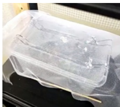
Produção de GANS